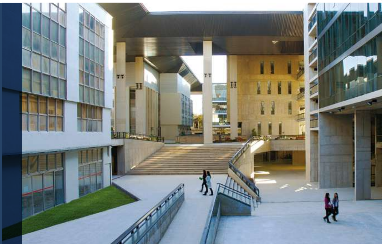
Foto: Edificio Almagro Norte