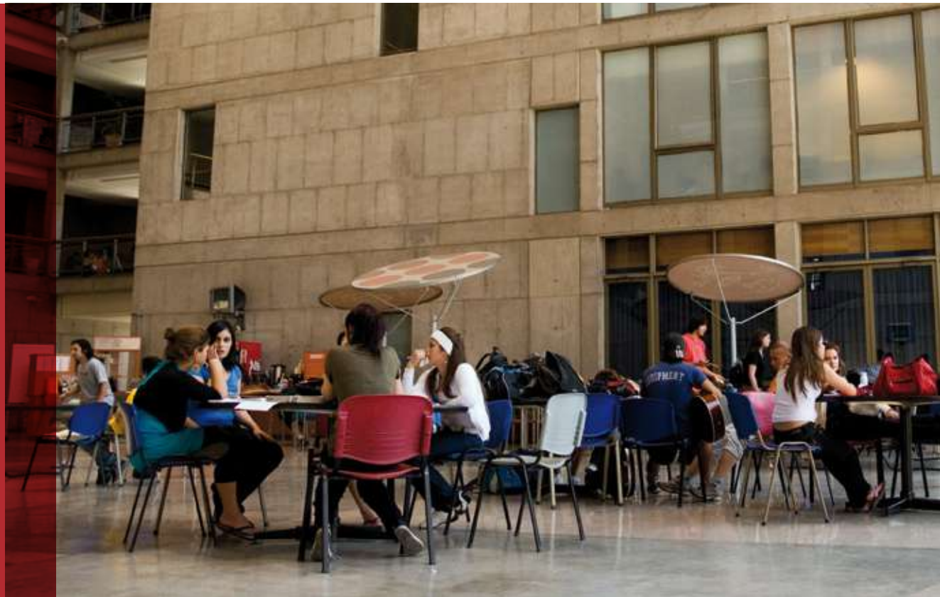
Foto: Edificio Vicente Kovacevic II